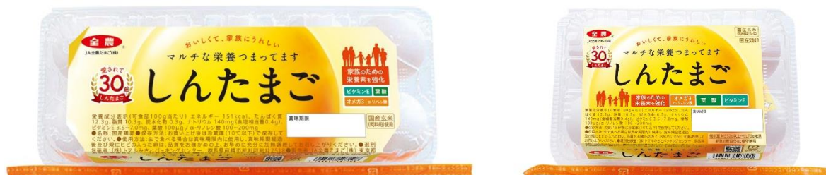
「しんたまご」新パッケージ（左：10 個入り、右：6 個入り）

鶏卵卸最大手の JA 全農たまご株式会社（本社：東京都新宿区、代表取締役社長：小島 勝）は、ロングセラー商品「しんたまご」の発売 30 周年を記念して、「しんたまご」シリーズのパッケージをフルリニューアルし、2021 年 6 月 1 日（火）から発売いたします。